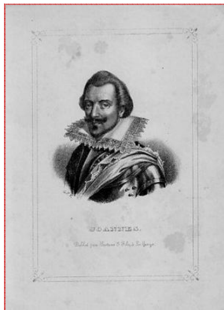
Johannes Stadius Litografia olandese della metà del XIX secolo

Joannes o Johannes Stadius, in fiammingo Jan Van Ostaeyen, in francese Jean Stade, matematico, astronomo e astrologo nonché storico nacque a Loenhout nella provincia di Anversa nel 1527 e morì a Parigi nel 1579. Il cratere Stadius sulla Luna porta il suo nome.